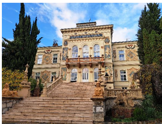
Idén a Pécsi Területi Bizottság adott helyszínt a rendezvénynek

2023. november 17-én második alkalommal rendezte meg a Magyar Tudományos Akadémia Kémiai Biológiai Munkabizottsága a Zechmeister Lászlóról elnevezett előadói versenyt, ahol a kutatásaikat a kémia és a biológia határterületén végző doktorandusz és doktorjelölt hallgatók mutathatták be eredményeiket. Az MTA Magyar Tudomány Ünnepe rendezvénysorozat részeként, idén az MTA Pécsi Területi Bizottsága (PAB) adott otthont a rendezvénynek, hogy az eseménnyel a