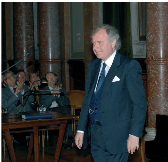
Schiff András zongoraművész