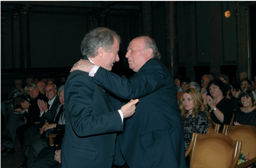
Két nagy művész őszinte barátsága: Schiff András és Kertész Imre