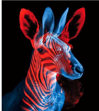
2. ábra. Binocularis rivalizáció https://aphantasia.com/binocular-rivalry/

A Kovács Ilona vezetésével működő magyar afantázia-kutatócsoport annyival tovább megy az objektivitási skálán, hogy a módszert kiegészíti a szemmozgáskövetés mérésével, tehát teljes mértékben függetlenítik magukat a v.sz. önbeszámolójától. (Aleshin et al. 2019, Ziman et al. 2022)