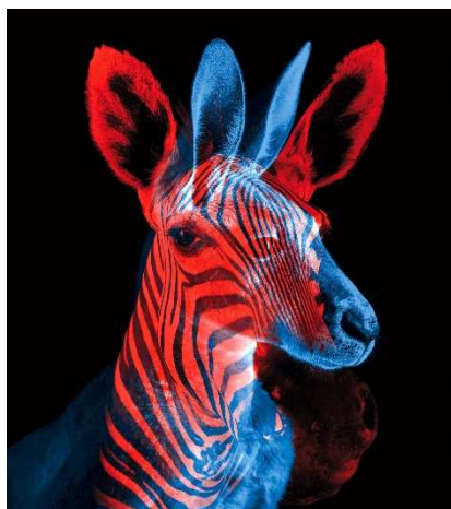
2. ábra. Binocularis rivalizáció https://aphantasia.com/binocular-rivalry/

A Kovács Ilona vezetésével működő magyar afantázia-kutatócsoport annyival tovább megy az objektivitási skálán, hogy a módszert kiegészíti a szemmozgáskövetés mérésével, tehát teljes mértékben függetlenítik magukat a v.sz. önbeszámolójától. (Aleshin et al. 2019, Ziman et al. 2022)