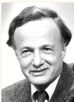
Polányi János (Berlin, 1929. január 23.)

Nobel-díjas kémikus, Kanadában élő egyetemi tanár, a Magyar Tudományos Akadémia tiszteleti tagja